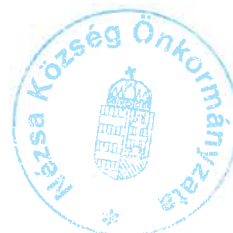
Styevó Gábor polgármester