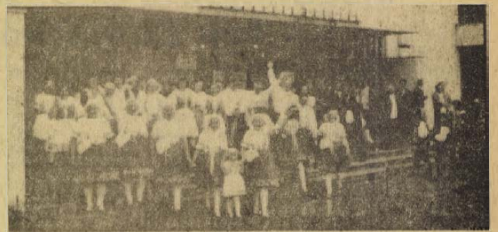
A kedvezőtlen, esős idő ellenére is sikeresen zajlott le a 10. Nógrád megyei nemzetiségi nap, melyet Bánk helyett Rétságon, a művelődési központban rendeztek meg. A megye 21 nemzetiségi községének képviselői — közöttük az erdőkürtiek is — adtak randevút egymással.