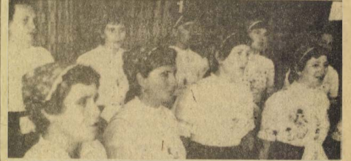
A nézsaiak kulturált énekésének valamennyien tapsoltunk.