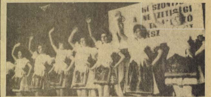
A vanyarciak, legéndiek, nógrádmegyeriek, terényiek és más községek együttese mellett figyelemreméltó a fiatal diósjenői csoport bemutatkozása.