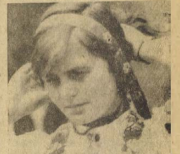
A járási székhely utcai délelőtti magyar, szlovák, német beszédűtől visszhangoztak.