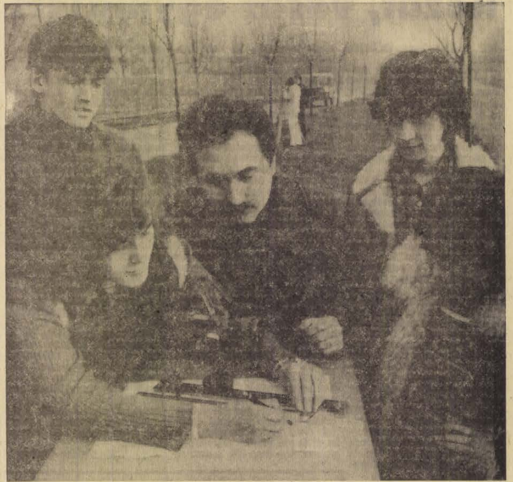
Az Asztalos János Kertészeti és Földmérési Szakközépiskola és Szakmunkásképző Intézetben földmérő szakembereket is képeznek. Az idén mintegy harminc fiatal végez a szakközépiskolában. A képen: szakmai gyakorlaton a III. éves földmérő tagozatos diákok